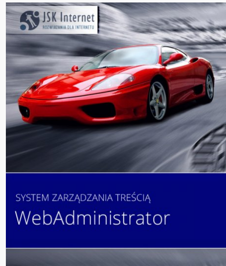
WebAdministrator dla Dealerów

strona dla dealera , strona dla autokomisu , program dla dealera , program dla komisji , program dla autokomisy